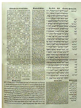
Biblia Políglota Complutense España 1514 - 1517

Por lo que se refiere a España, la primera imprenta la instala Johann Parix en 1472 en Aguilafuente (Segovia), donde imprime un Sinodal en tipos romanos, primer libro español de que se tiene noticia. También cabe destacar a Arnaldo de Brocar, que compuso la Biblia Políglota Complutense en seis tomos entre 1514 y 1517 por iniciativa del Cardenal Cisneros; en 1539 Juan Pablos fundó una imprenta en la Ciudad de México, introduciendo esta técnica en el Nuevo Mundo.