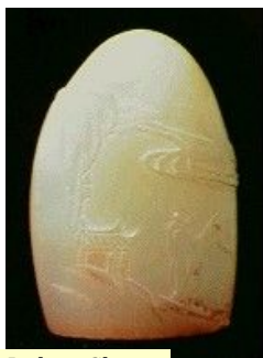
Sello en Jade - China

La utilización de las piedras para sellar quizá sea la forma más antigua conocida de impresión. De uso común en la antigüedad en Babilonia y otros muchos pueblos, como sustituto de la firma y como símbolo religioso, los artefactos estaban formados por sellos y tampones