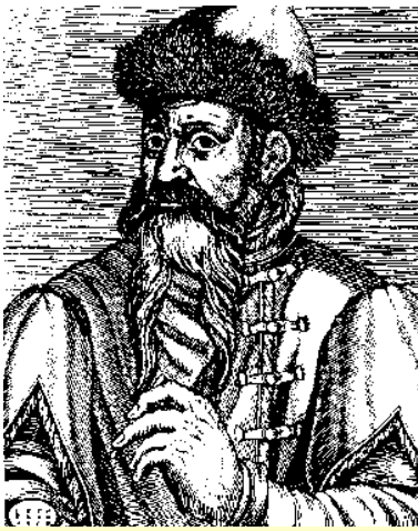
Johannes Gutenberg (1397 - 1468)

fundir letras sueltas y adaptar una prensa de uvas renana para la impresión de pliegos de papel, que es lo que constituyó la imprenta primitiva